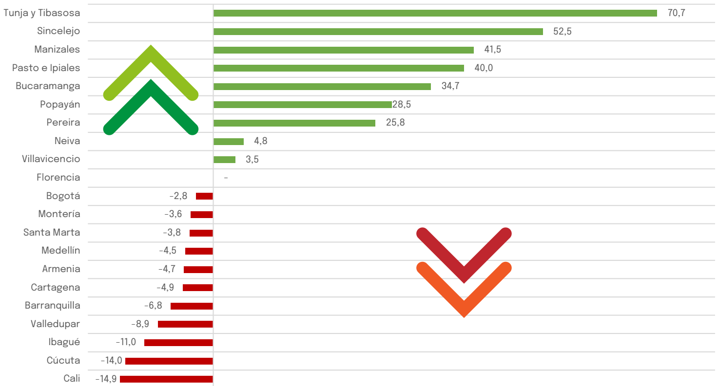
Figura 3. Variación porcentual del abastecimiento en las ciudades donde se encuentran los principales centrales mayoristas del país entre el 01 y el 26 de abril (2023/2022)