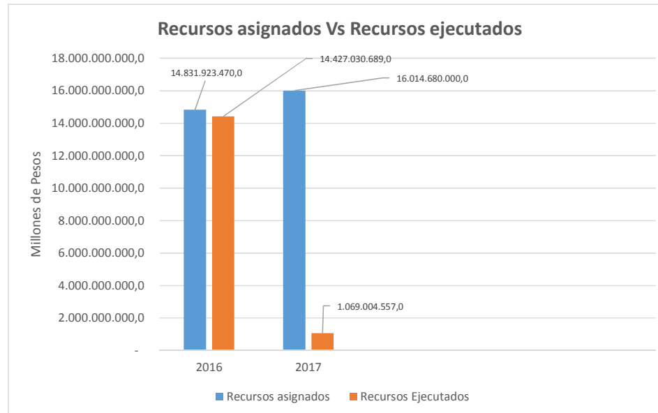
Gráfico N° 1