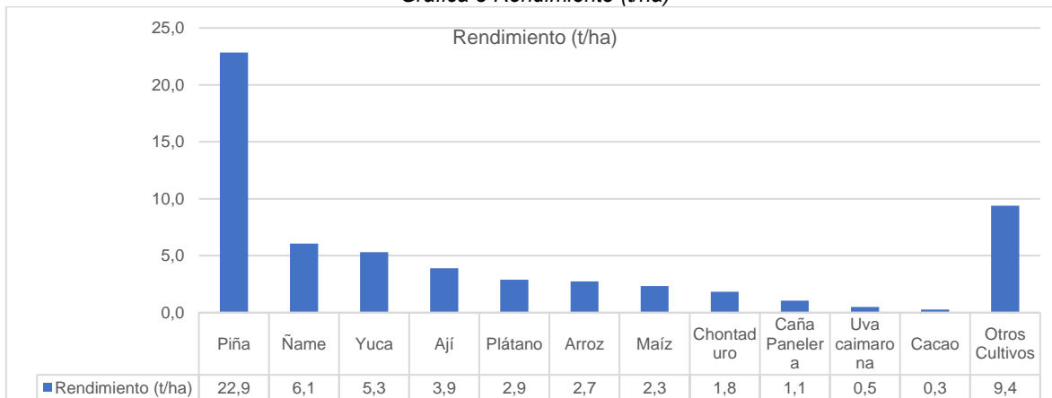
Gráfica 3 Rendimiento (t/ha)

En el caso del rendimiento se observa la piña (22,9 t/ha); ñame (6,1 t/ha); yuca (5,3 t/ha) y ají (3,9 t/ha) tienen los rendimientos más altos.