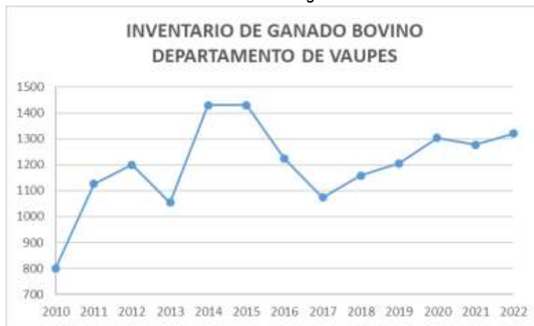
Gráfica 4 Inventario de ganado bovino